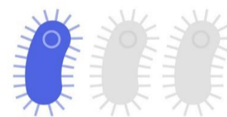
Resistenza agli antibiotici

Il microrganismo responsabile viene identificato nel 53% delle ICA negli ospedali, e solo nel 19% dei casi nelle strutture di lungodegenza.