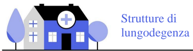
Strutture di lungodegenza